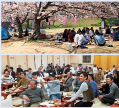
右の写真は2019年に撮影したものです。